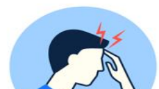
MAUMIVU YA KICHWA